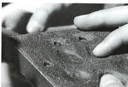
Wessen Spur ist das?

Infos: Wildnispark Zürich, Telefon 044 722 55 22 oder www.wildnispark.ch